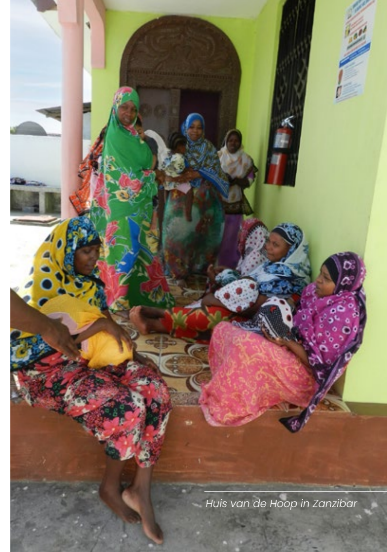
Huis van de Hoop in Zanzibar